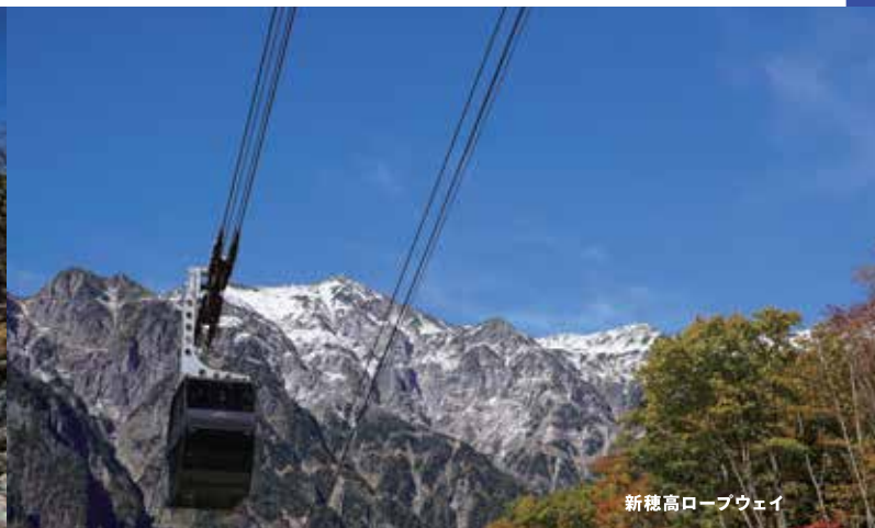
新穂高ロープウェイ