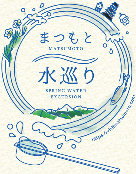
発行:松本市、松本観光コンベンション協会、新まつもと物語プロジェクト

松本は周囲の山々から生まれる 清らかな水を地下にたくわえた町です。 水をテーマに、歴史や町並みを 歩いて楽しめるコースをご案内します。