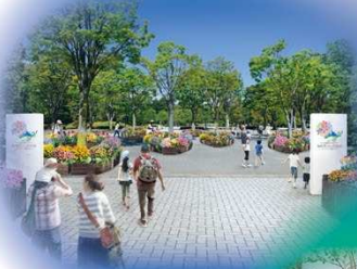
メイン会場 (出会いの広場)