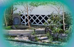
メイン会場 (庭園出展)