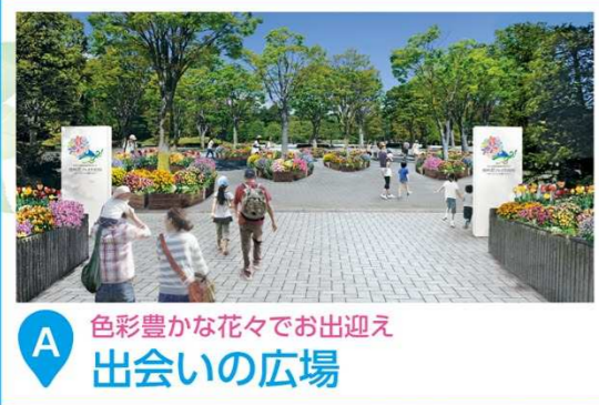
A 色彩豊かな花々でお出迎え 出会いの広場