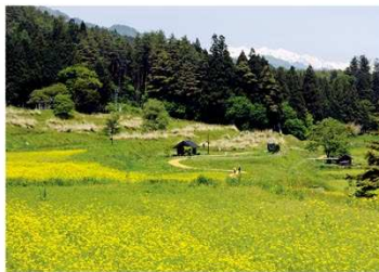
棚田に広がるナノハナ畑

安曇野を眼下に見る、棚田一面6ヘクタールに500万本のナノハナが広がる。 (見頃：4月下旬～5月上旬)