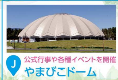
J 公式行事や各種イベントを開催 やまびこドーム