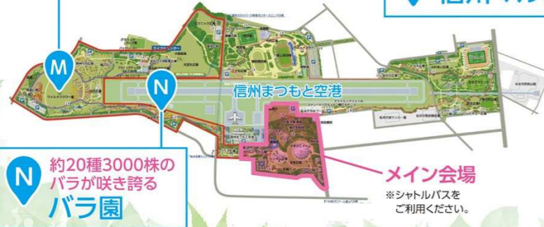
N 約20種3000株の バラが咲き誇る バラ園