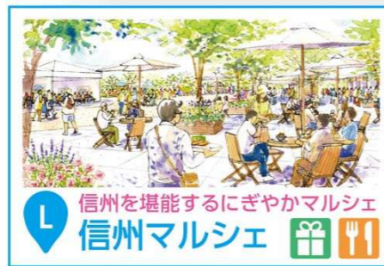
L 信州を堪能するにぎやかマルシェ 信州マルシェ