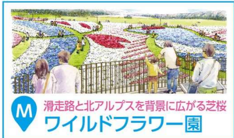
M 滑走路と北アルプスを背景に広がる芝桜 ワイルドフラワー園