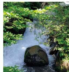
烏川渓谷 車イスが通行できるやさしい園路(苔の道)