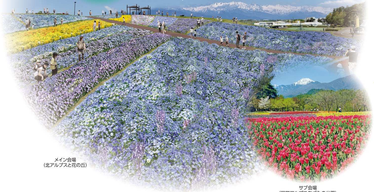
メイン会場 (北アルプスと花の丘)