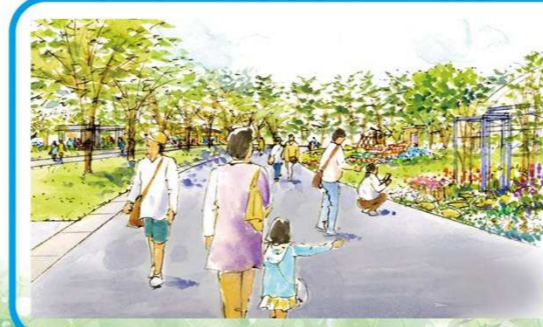
K みどりの専門家が 庭づくりの 技能を発信 信州の庭 (49区画)