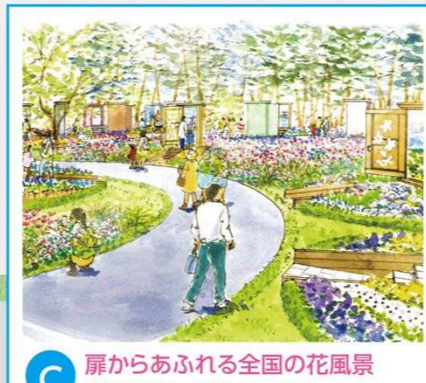
C 扉からあふれる全国の花風景 芸術と花の森 (17団体)