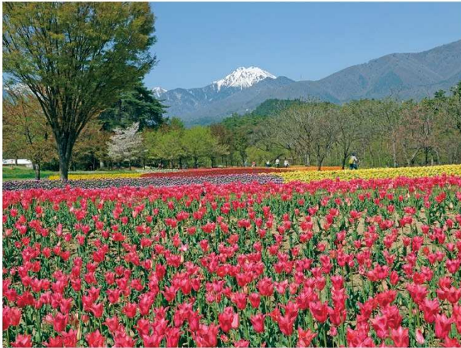
チューリップと常念岳

懐かしい里山の風景と雄大な緑や花をめぐり歩く 春から初夏の開花を楽しみ、ゲストを招いた多彩なイベントを開催。