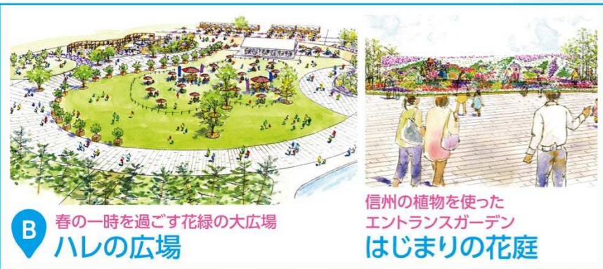
B 春の一時を過ごす花緑の大広場 ハレの広場

信州の自然や風土を体感し、 信州の暮らしの素晴らしさを実感できる会場 春から初夏へとみどりの装いが大きくかわる信州の2つの風景を、 木々の芽吹きとともに700品種55万株の花緑で満喫する会場