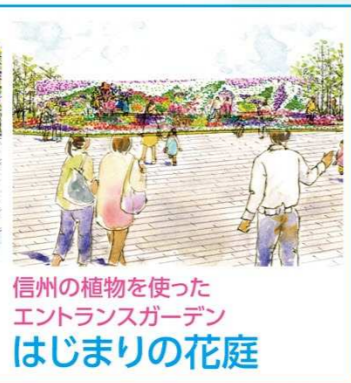
信州の植物を使った エントランスガーデン はじまりの花庭