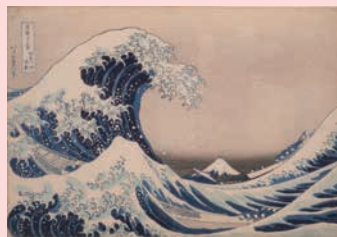
葛飾北斎 「富嶽三十六景 神奈川沖浪裏」

当館は昭和57年（1982）4月28日に開館し、今年で開館37年目を迎えます。この日を開館記念日として、当日は入館料の割引、さらに当館での展示は3年ぶりとなる、葛飾北斎「富嶽三十六景 神奈川沖浪裏」（右図）の他、北斎作品（4点）の特別展示を行います。