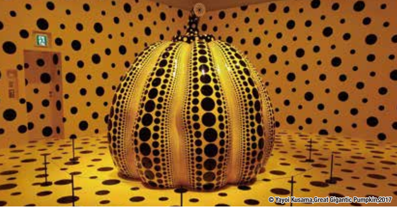
© Yayoi Kusama, Great Gigantic Pumpkin 2017