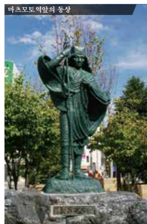
1829년- 사상 최초로 야리가타케 산 정상에 오른 반류 쇼닌의 동상.

1894년- 영국인 선교사 윌터 웨스턴이 가문지코야 산장의 가문지에게 안내를 받으며 마에호타카다케 산을 등반했습니다. 그 후 웨스턴은 '일본 알프스'라며 가미코치를 세계에 알렸습니다.