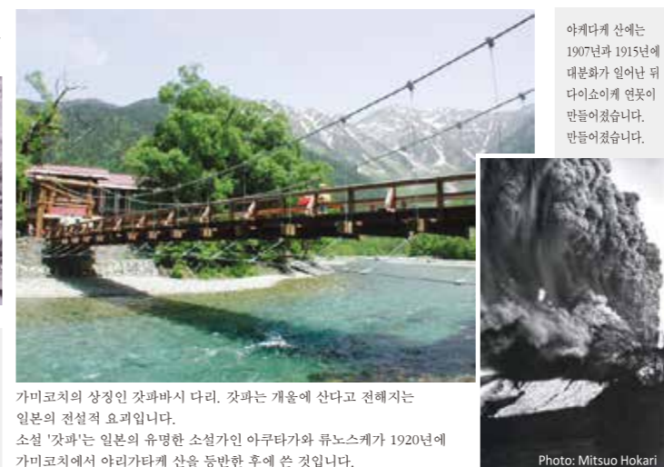
가미코치의 상징인 갓파바시 다리. 갓파는 개울에 산다고 전해지는 일본의 전설적 요괴입니다. 소설 '갓파'는 일본의 유명한 소설가인 아쿠타가와 류노스케가 1920년에 가미코치에서 야리가타케 산을 등반한 후에 쓴 것입니다.