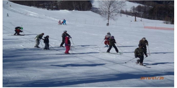
班分け後、緩斜面を使つての試乗の様子（前回の試乗会）