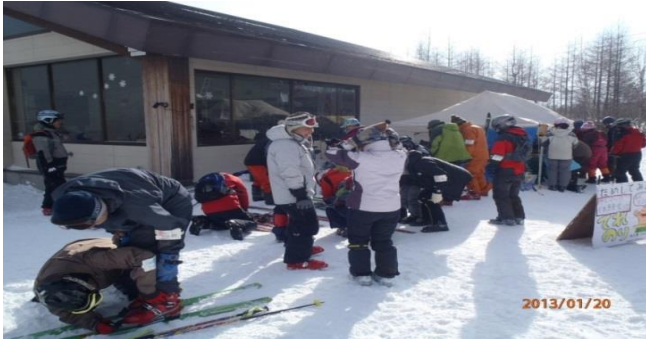
申し込みの対応に受付テントは大忙し（前回の試乗会）