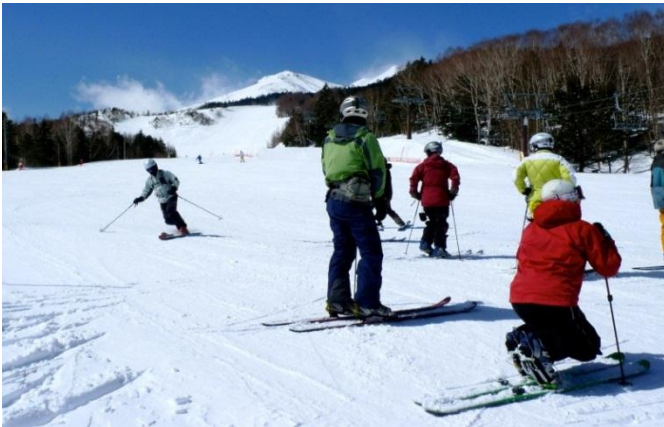
いっしょに滑れば上達も早い