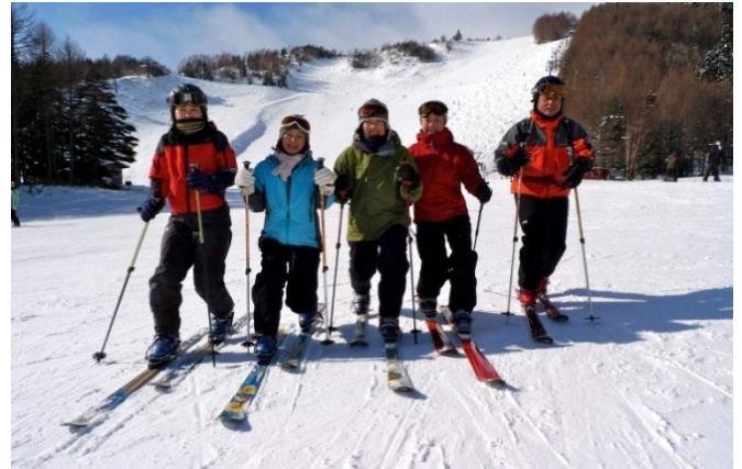
女性テレマーカー増殖中