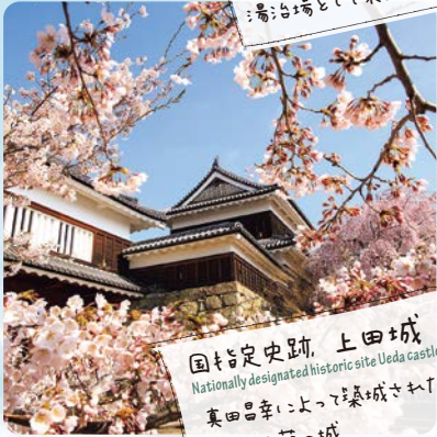
国指定史跡 上田城 Nationally designated historic site Ueda castle 真田昌幸によって築城された 難攻不落の城