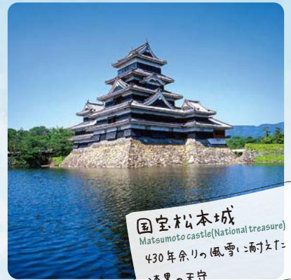
国宝松本城 Matsumoto castle (National treasure) 430年余りの風雪に耐えつた 漆黒の天守