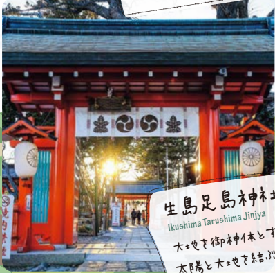
生島足島神社 Ikushima Tarushima Jinjya 木と石の御神木とする 太陽と木と石の三神