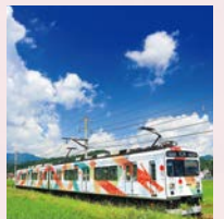
れいんどりーむ号

生島足島神社前バス停から上田電鉄別所線 下之郷駅まで 徒歩5分 ▶ 上田電鉄別所線 下之郷駅から別所温泉駅まで 約15分