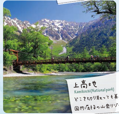
上高地 Kamikochi (National park) どこまで行っても美しい 国内屈指の山岳リゾート