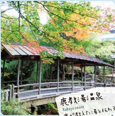
鹿教湯温泉 Kakeyu onsen 鹿が教えた湯といわれる 湯治場として栄えた名湯