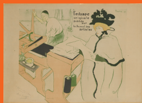
『レスタンプ・オリジナル』誌表紙 1893年 リトグラフ Couverture de "L'Estampe originale", 1893 Lithograph

ロートレックが版画を提供した出版メディアは、大衆的で娯楽性の高い雑誌から限られた愛好家向けの書籍まで、その傾向や購買層は多岐にわたります。風刺週刊誌『ル・リール』、版画集『彼女たち』、書籍『博物誌』、版画雑誌『レスタンプ・オリジナル』など、版画ならではの表現をご覧ください。