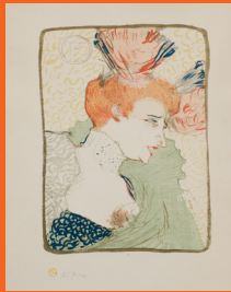
《マルセル・ランデル嬢の胸像》1895年 リトグラフ Mademoiselle Marcelle Lender, en buste, 1895, Lithograph

1880年代以降に一大歓楽街・娯楽の発信地となったモンマルトルで、ロートレックは、キャバレやダンスホールに通いつめ、その周辺に生きる都市の人々をくり返し描くようになります。本章では、カフェ・コンセールや劇場など、ロートレックが描いた世紀末パリの大衆文化を伝える作品を展示します。