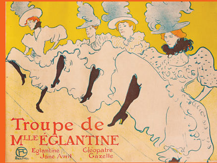
右上/《ディヴァン・ジャポネ》1893年 リトグラフ Divan Japonais, 1893, Lithograph 右下/《ジャヌ・アヴリル (文字のせ前)》1893年 リトグラフ Jane Avril (avant la lettre), 1893, Lithograph 左/《エグランティエ嬢一塵》1896年 リトグラフ La Troupe de Mademoiselle Églantine, 1896, Lithograph

ロートレックの代名詞ともいえるポスター。生涯において約30点を制作しています。ポスターは屋外に掲示されるため、破損や変色などの劣化により当初の姿をとどめていないことが多い中、フィロス・コレクションは状態の良いものを厳選し、さらに第三者が文字入れをする前の刷りをおもに収集しています。そのため、ロートレック自身のデザインをオリジナルに近い状態で鑑賞することができます。