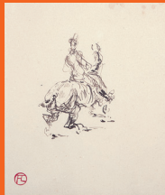
《騎手》1879-81年 ペン、インク/紙 Cavalier, 1879-81, Pen and ink on paper

鉛筆やペンなどモノクロの線による素描は、画家のありのままの視線、息づかいを直に感じることが出来る絵画といえます。版画と異なり、この世に1点しか存在しない素描。第1章では、フィロス・コレクションの核であり、ロートレック芸術の真髄に迫る、貴重な素描をまとめてご紹介します。